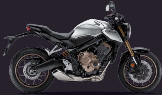
Mat Crypton Silver Metallic