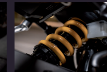
10단 프리로드 조절 리어 모노 서스펜션