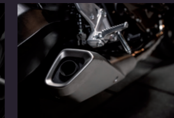
컴팩트 배기 시스템 & 새로운 머플러