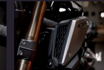
듀얼 에어 인테이크 덕트