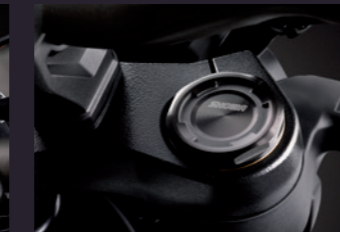
Showa 41mm SFF USD포크