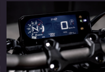
Full LCD 계기판