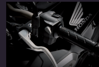
혼다 셀렉터블 토크 컨트롤 (HSTC)