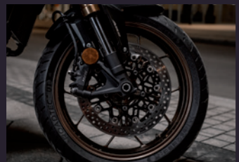
레이얼 마운트 브레이크 캘리퍼 & ABS