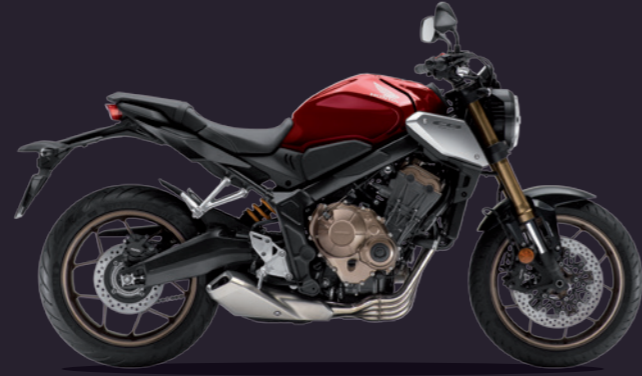
Candy Chromosphere Red